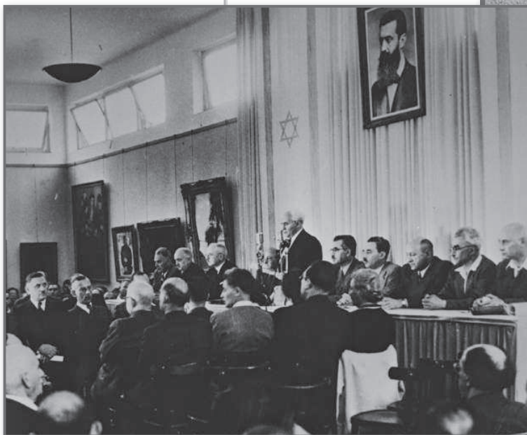
ראש הממשלה הראשון של ישראל, דוד בן-גוריון בעת טקס הכרזת העצמאות של מדינת ישראל. הטקס נערך ב-ה' באייר תש"ח (14.5.1948), באולם המוזיאון בתל אביב

כוחותיהם. למחרת הצבעת האו"ם, החלו התקפות ערביות על מטרות יהודיות, ולמעשה פרצה מלחמה, אשר לימים קיבלה בישראל את הכינוי "מלחמת השחרור" (ידועה גם כ"מלחמת העצמאות", "מלחמת הקוממיות", "מלחמת 1948"). אירועי המלחמה והקרבות הקשים הובילו בסופו של דבר למצב שבו ההכרזה על עצמאותה של ישראל הפכה להיות חד צדדית וניתנה בתאריך 14.5.1948 (ה' באייר תש"ח). תאריך זה אף נקבע כיום העצמאות של מדינת ישראל.